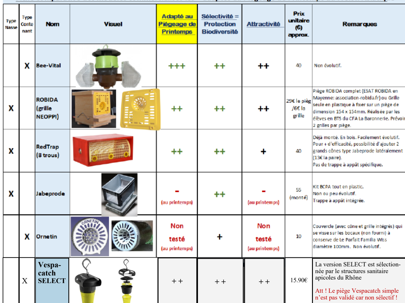
Fiche comparative des modèles commercialisés les + adaptés au Piégeage de Printemps du Frelon Asiatique